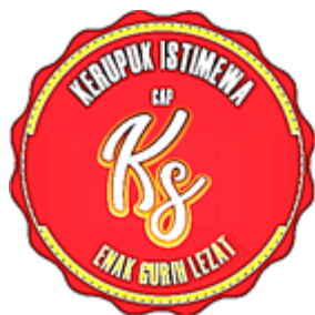
Gambar 4. Label Merek Versi baru

Rancangan label merek yang telah dibuat oleh tim pengabdian merupakan sebuah rekomendasi untuk pihak usaha kecil namun demikian tidak menjadi keharusan untuk diterima dan dipakai karena sepenuhnya menjadi keputusan pihak usaha kecil yang mungkin merasa lebih nyaman dan mudah dengan tetap menggunakan label versi lama.