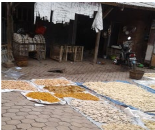
Gambar 1. Suasana Lokasi Usaha