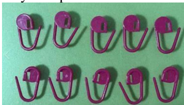
Gambar 7 : Aneka Penanda Rajutan (Stitch Marker)

Alat penanda rajutan juga bisa digunakan ketika kita menyambung benang yang habis atau mengganti warna benang rajutan dengan warna lain sehingga rajutan kita sebelumnya tetap aman.