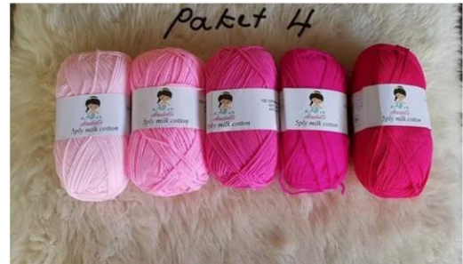
Gambar 2 : Benang Rajut Anabelle Ply 5 Seri Merah

Contoh variasi seri warna benang rajut yang dibagikan pada khalayak sasaran antara lain dapat dilihat pada gambar 2 dibawah ini.