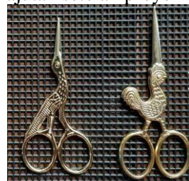
Gambar 5 : Aneka Gunting untuk Benang Rajut

Gunting digunakan untuk memotong benang rajut yang digunakan dan merapikan hasil rajutan setelah proyek selesai.