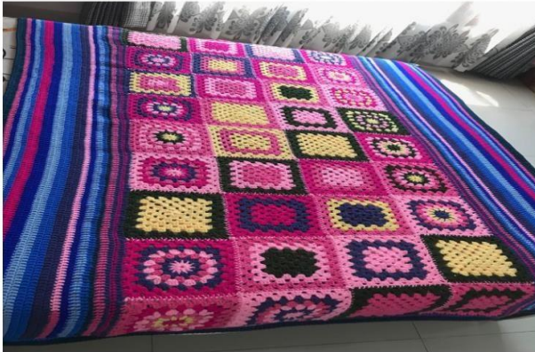
Gambar 12 : Hasil Granny Square Setelah digabungkan dalam bentuk Bed-Cover

lagi menyukai menyambungnya dengan cara merajutnya bersamaan dengan menggunakan sistem rajutan tunggal atau jahitan selip. Salah satu tampilan hasil akhir granny square yang telah digabungkan dapat dilihat pada gambar 9 dibawah ini dalam bentuk bed cover.