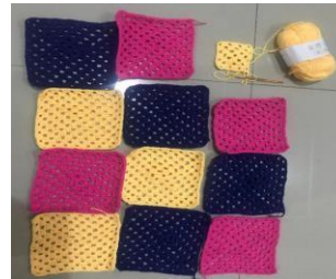
Gambar 10 : Sebagian Potongan Potongan Granny Square Hasil Karya Khalayak Sasaran

Beberapa khalayak sasaran telah berhasil melakukan modifikasi pattern dasar granny square yang diajarkan oleh fasilitator. Benang yang digunakan untuk membuat 1 potongan granny square tidak lagi hanya menggunakan 1 warna, namun telah mengaplikasikan dengan variasi benang warna lain, yang berarti ada ketrampilan lain yang dipraktekkan, yaitu menyambung benang dengan warna lain.