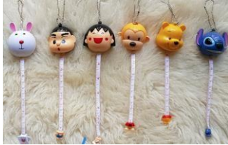
Gambar 6 : Aneka Meteran untuk Mengukur Produk Akhir Rajutan

masing-masing ukurannya harus sama supaya tidak menimbulkan masalah ketika nantinya akan disambung menjadi satu. Selain itu digunakan juga untuk mengukur produk akhir yang akan dihasilkan.