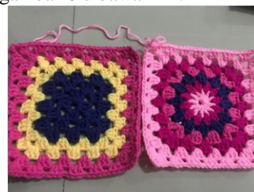
Gambar 11 : Modifikasi Pattern Granny Square Hasil Karya Khalayak Sasaran

Selain itu, pattern lingkaran tengah juga telah berhasil dimodifikasi dari bentuk dasar granny square menjadi bentuk matahari. Kedua modifikasi tersebut diatas dapat dilihat pada gambar 8 dibawah ini.