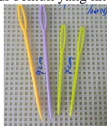
Gambar 8 : Aneka Jarum Rajut

Jarum rajut memiliki lubang jarum yang lebih besar dibandingkan dengan jarum jahit biasa, dan biasanya terbuat dari bahan plastik sehingga ketika kita gunakan tidak akan merusak benang rajut. Jarum sulam berfungsi sebagai alat untuk menggabungkan masing-masing potongan Granny Square yang telah dihasilkan menjadi bentuk yang kita inginkan.