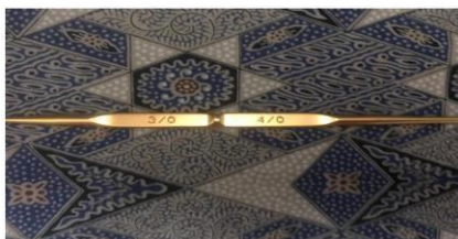
Gambar 1 : Hook / HakPen / Hakken

Ukuran hakpen yang umum digunakan adalah 3/0 atau 4/0, namun untuk proyek membuat Granny Square Pattern kali ini hakpen yang digunakan adalah no 7/0 menyesuaikan dengan jenis benang yang dipakai.