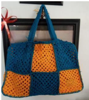
Gambar 13 : Pengembangan Hasil Akhir Gabungan Granny Square dalam bentuk Tote Bag

Beberapa khalayak sasaran berhasil mengembangkan hasil akhir dari granny square setelah digabungkan menjadi bentuk lain, salah satunya adalah produk Tote Bag / Tas Cangklong seperti terlihat pada gambar 10 dibawah ini.